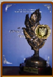
ЛІЦЕЙ - ФЛАГМАН ОСВІТИ УКРАЇНИ